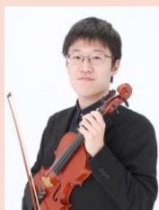
木村 光輝/ヴァイオリン